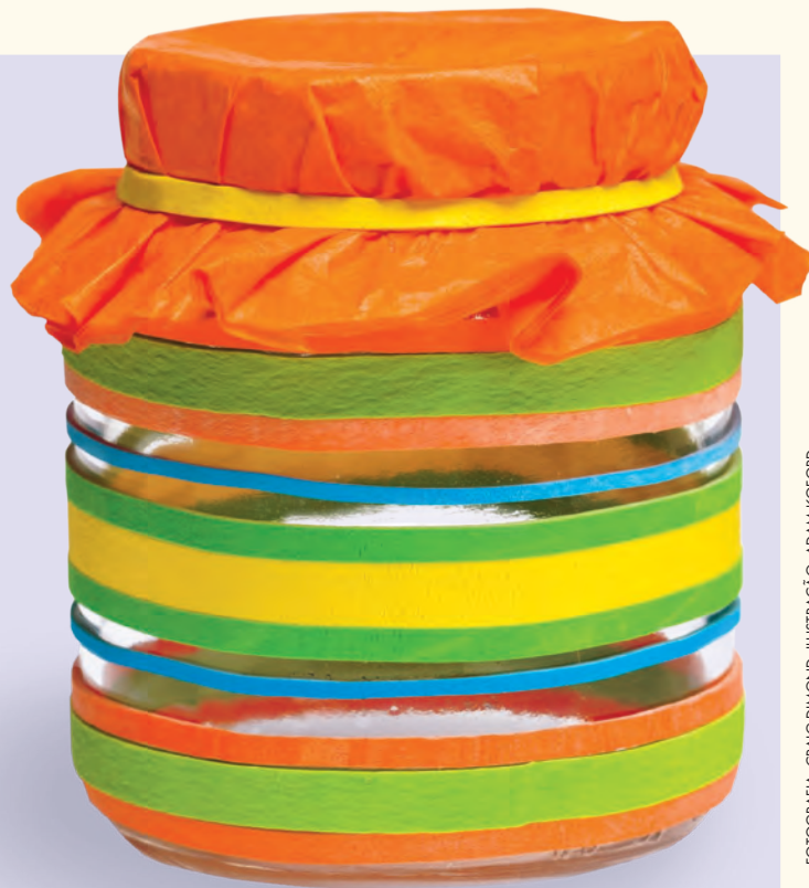
ILUSTRAÇÃO: ADAM KOFORD