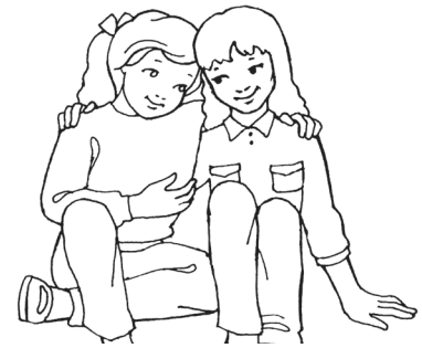
... e le losilosivale.