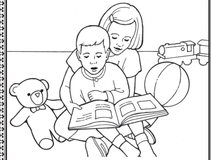
... e le sailia e ia ana lava mea.

Valivali ia ata, ma faaoga seleulu e oti ese ai le siepi i luga o laina uliuli. Gagau uma laina togitogi, ma kelu pe faaipii ia vaega tautau e faia ai se sikuea. Togi le sikuea ma faasoa mai pe mafai faapefea ona e faaali atu le alofa i auala lea e ũ i luga. Afai e ũ i luga le upu alofa , faasoa mai se auala na faalia ai e le Faola Lona alofa.