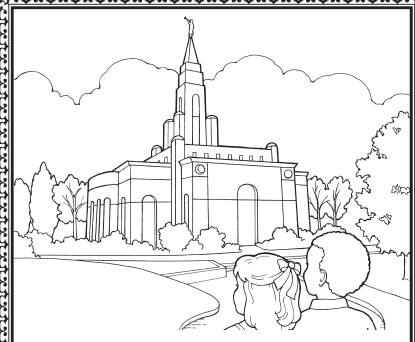
... e le mafaufau i le leaga.