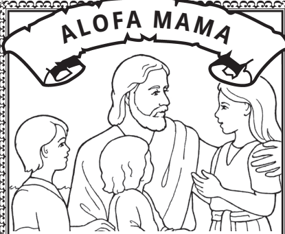
O le alofa mama o Keriso