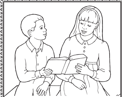
... e fiafia i le faamaoni.