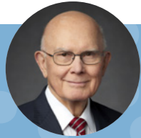
President Dallin H. Oaks Eerste raadgever in het Eerste Presidium