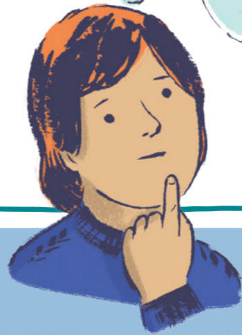
삽화: 케티 도크렐