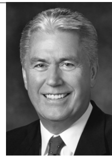
සභාපති ඩීටී එච්. උක්බෝග් විසිති පළවෙනි සභාපතිත්වයේ දෙවන උපදේශකවරයා