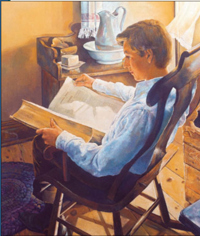
කුමණ සභාවකට සම්බන්ධ විය යුතුද කියා තීරණය කරගැනීමේදී, මහපෙන්නීම පිණිස ජෝසප් තුමා බයිබලයට යොමු විය. දෙවියන් වහන්සේගෙන් අහන්න කියා එහිදී ඔහු කියවුවේය.

එදින පටන් ජෝශප් දෙවියන් වහන්සේට සේවය කිරීමට වෙනසෙමින් යේසුස් ක්‍රිස්තුස් වහන්සේගේ පසු දවස් වල ශුද්ධවරයන්ගෙන් යුත් සභාව පිහිටුවීමටත් පසු දවස් වලදී දෙවියන් වහන්සේගේ