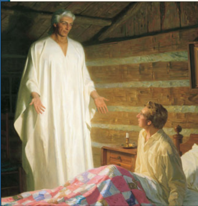
ජෝසෆ් ස්මිත් තුමාගේ පළවෙනි දර්ශනයෙන් වර්ෂ තුනකට පසු යේසුස් වහන්සේගේ ශුභාරංචිය නැවත පිහිටුවීම සඳහා උපදෙස් දීමට මොරෝනයි දේවදූතයා දෙවියන්වහන්සේ එවූයේය.

ලදී. නොමේරූ තරුණ වයසෙහි සිටි මා මගේ මිතුරන් විය යුතුවූද, මම කරුණාවෙන් සැලකිය යුතුවද, මා මුලාවී ඇතැයි සිතුවානු නම්, යෝග්‍ය සහ දයානවිත ආකාරයකින් මා මුදා ගැනීමට උත්සාහ කළයුතුවූද අය විසින් හිංසා කරනු ලැබූ මම සියළු ආකාරයේ පෙළඹීම් වලට භාජනය වීම්. සියළු වර්ග වල සමාජ සමග මිශ්‍ර වෙමින් නිතර බොහෝ අර්ථන වැරදි වලට වැටුණු අතර, තරුණ වියේ දෝෂයන්ද මිනිස් බවේ දුර්වලකම්ද විදහා දැක්වීම්. දෙවියන් වහන්සේ ඉදිරියෙහි වරද සහගත වන අනේක පෙළඹීම් වලට භාජනය වූ බව කීමට මම කනගාටු වෙමි. මේ පාපොච්චාරනය කිරීම නිසා මා ඉතා උග්‍ර පාපයන් කිසිවකට වරදකරුයයි කිසිවෙකුට සිතිමට උවමනා නැත. එවැනිකක් කිරීමට සිතිම ගේ ස්වභාවය නොවීය. මා මෙම කීවාට පසු බොහෝ ආගමික මාභාවාර්යවරුන් කලබලයට පත්වී, මට හිංසාපීඩා සිතිම මගේ ස්වභාවය නොවීය.