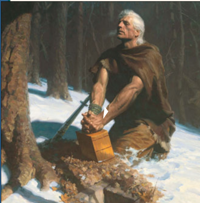
වර්ෂයේදී අනාගතවත්තා මොරෝනයිතුමා තම ජනතාවගේ ඉදිකළ වූ වාර්තා කුමාරෝ කන්දෙහි වැළලුවේය. පසුව උන්වහන්සේ භාවයකින් නැවත පැමිණ, පැරණි වාර්තා ගැන ජෝසෆ් සමීන් කුමාර කීවේය. ඇමරිකා මහද්වීපයේ පැරණි වැසියන්ට ගැලවුම්කරුවාණන් වහන්සේ යුත් සම්පූර්ණ ශුභරූචිය එහි අඩංගුවන බව කීවේය. මොර්මන්ගේ පොත එම වාර්තාව වේ.

මේ මහත් මහද්වීපයේ පෙර විසූවන්ගේ ඉතිහාසය, ඔවුන් පැවත එන ප්‍රභවය දක්වන රත් තහඩු මත ලියන ලද පොතක් තැන්පත් කර ඇති බව ඔහු කීවේය. ගැලවුම්කරුවාණන් විසින් පැරණි වැසියන්ට කියා දෙන ලද සදාකාලික