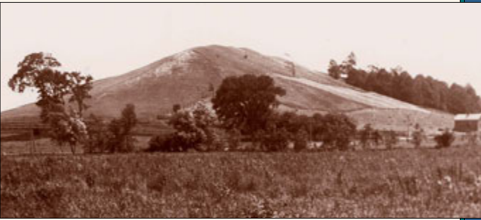
නිව්යෝක් නගරයේ පැල්මයිරාහි සමීන් ගොවිපලට දකුණු පසින් සැතපුම් තුනක් පමණ ඇති නියුමෝරා තන්ද පිහිටා තිබුණේය. ජෝසෆ් තුමාගේ කාලයේ භවා උතුරු කොටස තණකොළ වලින් වැසී තිබුණි. දකුණු පස ගස්වලින් වනයෙන් යුක්ත විය. මුදුනට නුදුරින් දකුණු බටහිර පැත්තේ තහඩු වළලා තිබුණි. පිංතූරය අගෝස්තු 1907.

“මුහුණ මා අමතා, පළමු පැමිණීමේදී කලාත් මෙන් ස්වල්පයකුදු වෙනස් නොකොට, එම කරුණුම ප්‍රකාශ කළේය. ඉන්පසු මෙලොවට පැමිණීමට යන සාගත යුද්ධ හා දරුණු රෝග ඇතුළත් මහත් විපත් සමග දේව උදහසින් ලැබෙන දඩුවම් ගැනද ඔහු මට දැනුම් දුන්නේය. තවද මේ හයංකාර දඩුවම් මේ පරම්පරාව තුළදීම ලොවට ලැබෙන බව ඔහු කීවේය මේ කරුණු පහදා දුන් පසු පෙරමෙන් නැවතද අහසට නැගී ගියේය.