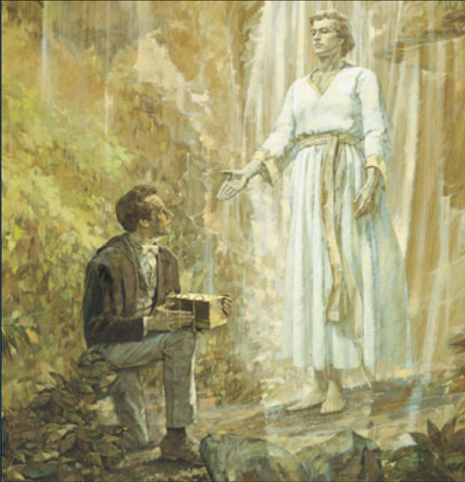
අවුරුදු පසා අවුරුදු හතරක්ම මොරෝනයි නැවත පැමිණි කරුණ අනාගතවක්තාවරයාට තවත් උපදෙස් ලබාදුන්නේය. අවුරුදු හතරක් අවසාන වූ විට ජෝසෆ් කුමාරි තහඩු ලැබී මොර්මන්ගේ ග්‍රන්ථය පරිවර්තනය කිරීම ආරම්භ විය.

මේ තුන්වැනි පැමිණීමට පසු පෙර ඔහු නැවතත් ස්වර්ගයට නැගී ගියෙන් මා අත්දැකූ කරුණු බව