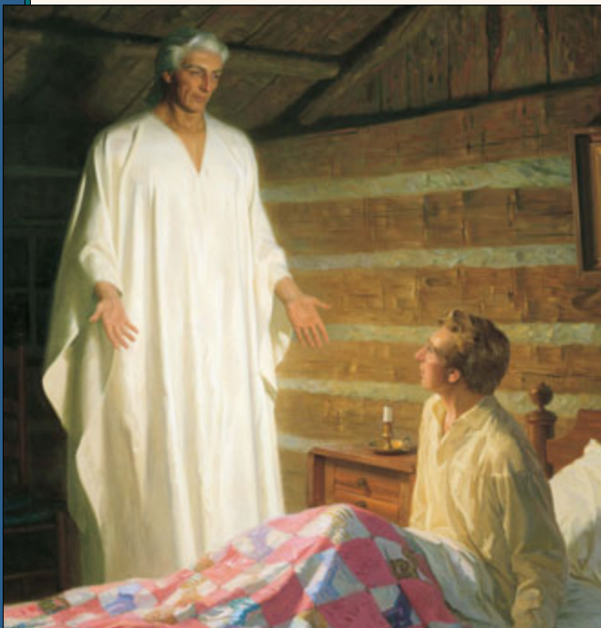
ஜோசப் ஸ்மித்தின் முதல் தரிசனத்திற்கு மூன்று வருடங்களுக்குப் பிறகு இயேசு கிறிஸ்துவின் சவிசேஷத்தின் மறுஸ்தாபிதத்தைப்பற்றி ஜோசப்பிற்கு உபதேசிக்கும்படி, மரோனி என்ற தூதனை தேவன் அனுப்பினார்.

மேலே சொல்லப்பட்ட செப்டம்பர் மாதம் இருபத்தி ஒன்றாம் தேதி மாலையில், அந்த இரவில் தூங்குவதற்காக நான் படுக்கைக்குச் சென்ற பின்பு தேவனுடைய பார்வையில் என் நிலையையும் என் தகுதியையும் நான் அறிந்து கொள்வதற்காக எனக்கு ஒரு வெளிப்படுத்துதல் கிடைக்கும்படியாகவும் சர்வ வல்ல தேவனிடம் ஜெபம் செய்யவும் விண்ணப்பம் செய்ய ஆரம்பித்தேன். முன்னமே எனக்கு கொடுக்கப்பட்ட வெளிப்பாடு போன்று நான் ஒரு