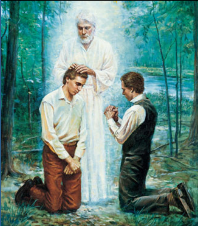
1829ம் வருடம் மே மாதம் 15 ஆம் தேதி யோவான் ஸ்நானகனிமீருந்து, தலைகள் மேல் கைகளை வைப்பதன் மூலம், ஜோசப் ஸ்யீத்தும் ஆலிவர் கௌட்ரியும் ஆரோனின் ஆசாரியத்துவத்தைப் பெற்றார்கள்.

நாங்கள் மொழிபெயர்ப்பு வேலையைத் தொடர்ந்து செய்து கொண்டிருந்த மாதத்தில் 1829 ஆம் வருடம் மே மாதம் ஒரு குறிப்பிட்ட நாளில் நாங்கள் தகடுகளின் மொழிபெயர்ப்பில் சொல்லப்பட்ட பாவ மன்னிப்புக்கான ஞானஸ்நானத்தைக் குறித்து கர்த்தரிடத்தில் விசாரிப்பதற்காகவும் ஜெபிப்பதற்காகவும் காட்டுக்குள் சென்றோம். இவ்விதமாக கர்த்தரை நோக்கி ஜெபித்துக் கூப்பிட்டுக் கொண்டிருக்கும் சமயத்தில், ஒளிமயமான மேகத்தில் ஒரு தூதன் பரலோகத்திலிருந்து இறங்கி வந்து, எங்கள் தலைகளின் மேல் தன் கைகளை வைத்து அபிஷேகம் செய்து கூறியதாவது: