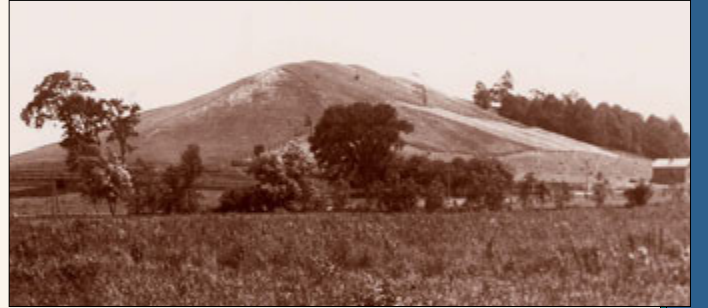
நியூயார்க்கின் பல்மைராவிலுள்ள ஸ்மீத் பண்ணையிலிருந்து தென்கிழக்காக சுமார் 3 மைல்கள் தூரத்தில் குமேரா குன்று இருக்கிறது. ஜோசப்பின் காலத்தில் வடக்கு எல்லை புல்வெளிகளாலும் தென்பகுதி பரவலான மரங்களாலும் காடுகளாலும் நிறைந்திருக்கிறது. குன்றின் உச்சிக்கருகில் தென்மேற்கு திசையில் தகடுகள் புதைக்கப்பட்டிருந்தன. புகைப்படம் ஆகஸ்டு 1907.

இந்நேரத்திலே என் கண்களிலிருந்து தூக்கம் பறந்தோடிப் போகக் கூடியதாக அவை என் மனதில் அவ்வளவு ஆழமாக பதிந்துவிட்டன. நான் கண்டவைகளாலும் கேட்டவைகளாலும் அடைந்த ஆச்சரியத்தால் மேற்கொள்ளப்பட்டு படுக்கையில் படுத்திருந்தேன். இந்நிலையில் என் படுக்கையருகில் மூன்றாம் முறையும் அதே தூதனை நான் கண்டது எனக்குச் சொல்லமுடியாத ஆச்சரியத்தை கொடுத்தது. முதல் இரண்டு முறையும் என்னிடம் சொன்ன அதே காரியங்களை அவர் என்னிடம் மறுபடியும் சொல்வதை நான் கேட்டேன். என் தந்தையின் குடும்பத்தின் ஏழ்மை