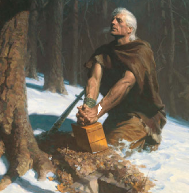
கி.பி. 421ல் தீர்க்கதரிசி மரோனி தனது ஜனங்களின் பரிசுத்தப் பதிவேடுகளை குமோரா குன்றில் புதைத்து வைத்தார். பின்னர் உயிர்த்தெழுந்தவராக திரும்ப வந்து அமெரிக்க கண்டத்தில் வசித்து வந்தவர்களுக்கு இரட்சகரால் கொடுக்கப்பட்ட பூரண சுவிசேஷம் பூரணத்துவம் அடங்கியுள்ள முற்காலத்து பதிவேட்டைப்பற்றி ஜோசப் ஸ்மித்திடம் சொன்னார், அந்தப் பதிவேடுதான் மார்மன் புத்தகம்.

மேலும் என்னிடத்தில் அவர் சொல்லிய தகடுகளை நான் பெற்றுக் கொள்ள வேண்டிய காலம் இன்னும்