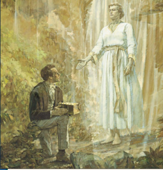
மரோனி வருடத்திற்கு ஒரு முறையாக நான்கு வருடங்களுக்கு இந்த தீர்க்கதரிசிக்கு உபதேசம் பண்ணினார். அந்த நான்கு வருடங்கள் முடிந்த பின்பு ஜோசப் தகடுகளைப்பெற்று மார்மன் புத்தகத்தை மொழிபெயர்க்க ஆரம்பித்தார்.

மூன்றாம் முறையாக அந்தப் பரலோகத் தூதன் என்னிடத்திலிருந்து பரலோகத்திற்கு மேலே எழும்பிச் சென்றவுடனேயே சேவல் கூவிற்று. விடியற்காலை நெருங்கிக் கொண்டிருக்கிறது என்று கண்டேன். இதிலிருந்து எங்களுடைய சம்பாஷணை இரவு முழுவதும் நடந்திருக்க வேண்டும் என்பதை உணர்ந்தேன்.